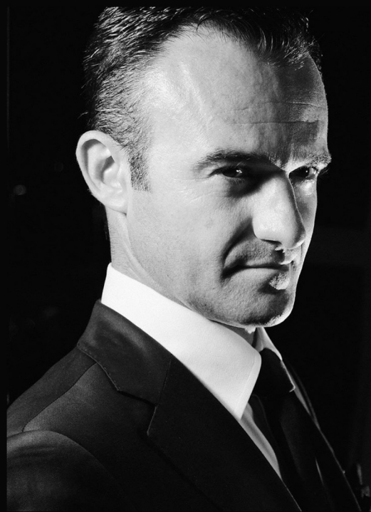
M sterclass: T cnica vocal Jazz band

El Centro de Cultura Contempor nea de Gran Canaria incluy  su proyecto "Fasur Quartet" como cierre de cartel en el programa "San Mart n Sonoro" dedicado a "M sicas Paralelas" .